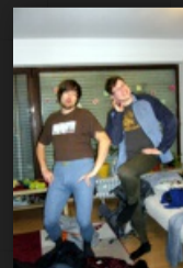
Helden in Strumpfhosen**