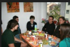
Ein langes Frühstück

Ein schönes Wochenende mit viel Spaß, lachenden Gesichtern, der ein oder anderen Runde Smallworld, großen Pizzas, Neuseeland Bildern und einer kleinen Geburtstagsfeier mit tollen Freunden ging zu Ende.