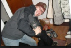
Warm anziehen im Winter**