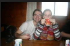
Die Augen links!*

Der Schnee reichte uns auf dem ungeräumten Waldweg bis über die Knöchel. Die Flocken waren groß. Die Sicht betrug im Wald nur wenige Meter. Auf halber Strecker kaum uns der erste Rodler entgegen. War es ein Leihschlitten? Hatte die Alm geöffnet? Nach 50 Minuten erreichten wir durchgeschwitzt die Hütte. Die erste Tür war verschlossen. Es war - der Hintereingang. Vorn war offen. Der Gastraum war gut besucht. Es war warm und wir bestellten heiße Schokolade und genossen die Wärme.